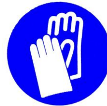
Gants de manutention