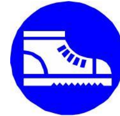
Chaussures de sécurité fermées (les sabots de sécurité sont interdits)

Un chauffeur non équipé ne sera pas chargé/déchargé